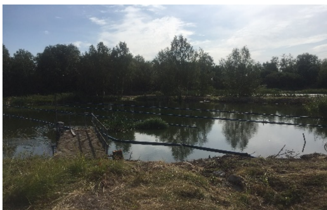
Muddring samt röjning av fällningsdammar har utförts vid Karbennings reningsverk

Fällningsdammar vid Karbennings reningsverk har muddrats våren 2020