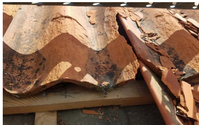
Takrenovering, Kärrgruvans skola

Även akuta skador uppstår och i samråd med respektive verksamhet åtgärdas dessa.