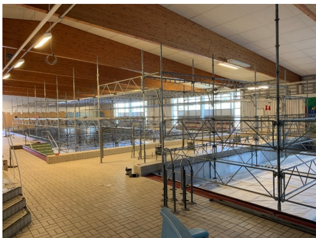
Renovering Fagerstahallen, vattenskada

Fagerstahallens simhall får en rejäl ansiktslyftning i samband med reparation av en fuktskada. Fuktskadans omfattning har växt vart efter rivningsarbeten pågått, vatten rör, avloppsrör, bärande konstruktioner samt golv och tak har åtgärdats, nu pågår återställning av yttertak, ytskikt med klinker och kakel, belysning, glaspartier mm. Etapp 1 beräknas vara klar under december månad 2020.