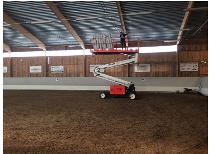
Byte belysning Hedkärrens ridanläggning

Vakansgraden för bostadsbeståndet i Fagersta är 3,7% jämfört med föregående år 3,1%. Antalet outhyrda lägenheter uppgick per 200831 till 6 mot 5 vid samma tidpunkt förra året. Några av orsakerna är renovering och sanering av flertal lägenheter.