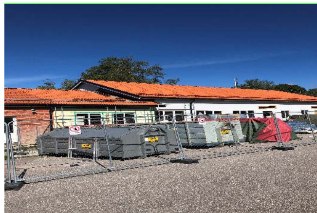
Om- och tillbyggnad Källskolan, Norberg

Om- och tillbyggnad Källskolan avser tillbyggnad av personalutrymmen med nya administrations-lokaler, kurator etc. Utbyggnad av befintlig matsal. Beräknad färdigställande tid hösten vecka 48.