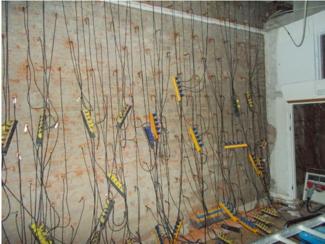
Urtorkning av fuktskadad yttervägg, Brinellskolans aula

Fastighets uppdrag är att förvalta och underhålla fastigheterna och bostäder så att dessa håller en bra standard, ser till att besiktningar och myndighetskrav uppfylls. Detta sker på daglig nivå med ett planerat och akut underhåll.