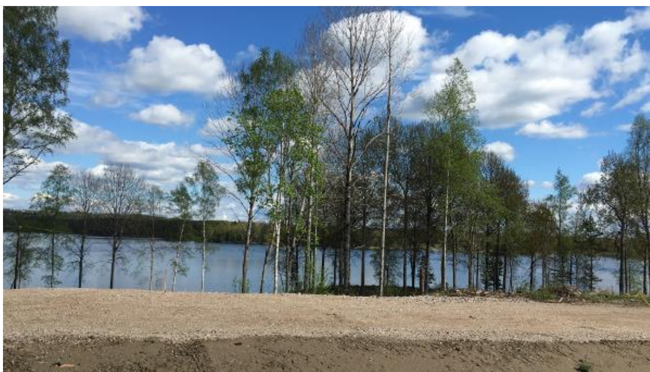
Tomter vid sjön Noren.