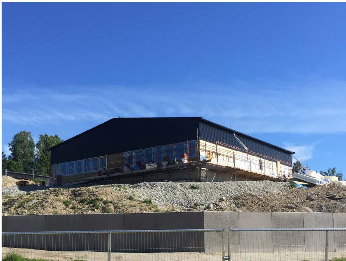
Utbyggnad Per-Ols skolan Hus C

Utförarenheterna ger tillsammans ett överskott på 0,6 Mkr.