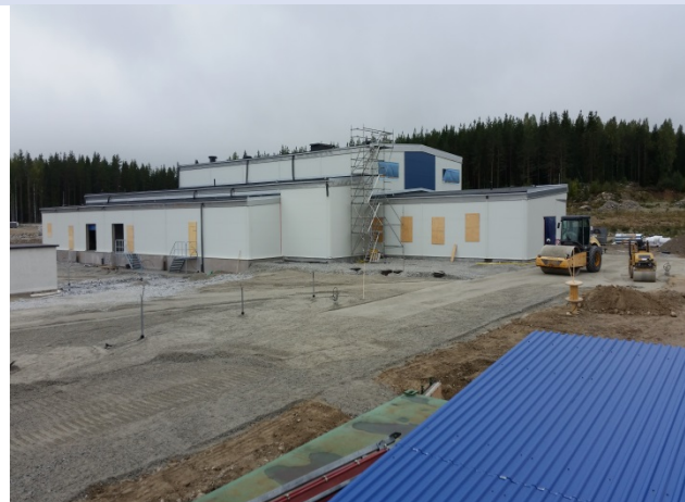
Nybyggnation Centralkök Fagersta

Malmen har fått en fin ny uteplats samt brandlarm och sprinklersystem har installerats på Hedkärra ridanläggning.