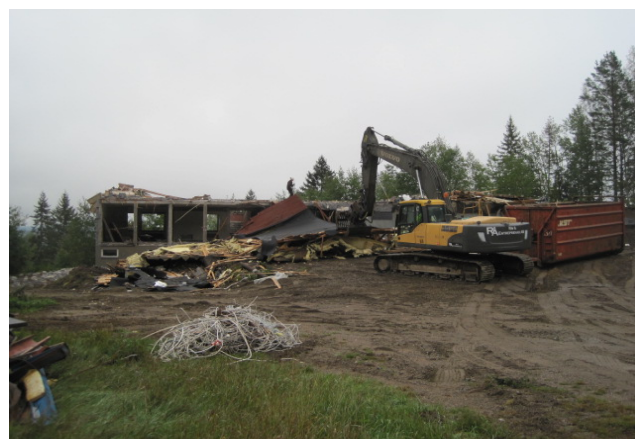
Rivning av Högbyn

Några andra åtgärder som kan nämnas är upprustning av lekutrustningar samt staket på förskolor i Norberg och Fagersta. Allt för att få säkrare och modernare utrustningar för barnen. Rivningen av Högbyn påbörjades i början av 2018 där alla byggnader, belysningar demonteras. Vi har färdigställt en utbyggnad och renovering av Alfaskolan.