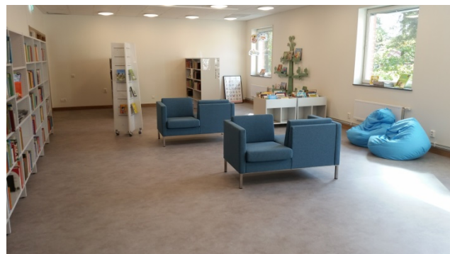
Nytt bibliotek på Alfaskola