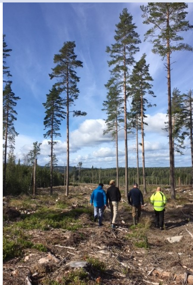
Certifieringskontroll ute i fält

Sommaren 2017 antogs den nya skogsbruksplanen av Fagersta kommunfullmäktige och i oktober mottog vi våra bevis för certifieringarna FSC och PEFC. Under våren har vi bland annat arbetat med fältbesök och avdelningarnas målklassningar.