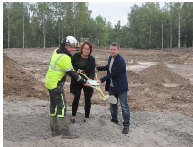
Första spadtaget på nya förskolan Skogsglántan