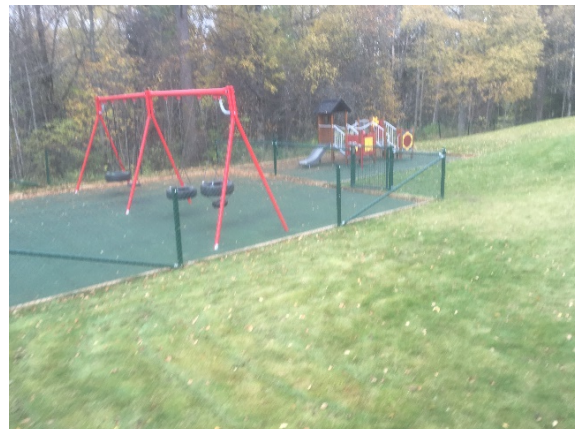
Nya lekutrustningar förskolor Fagersta och Norberg

Några andra åtgärder som kan nämnas är upprustning av lekutrustningar samt staket på förskolor i Norberg och Fagersta. Allt för att få säkrare och modernare utrustningar för barnen. Rivningen av Högbyn påbörjades i början av 2018 där alla byggnader, belysningar demonteras. Vi har färdigställt en utbyggnad och renovering av Alfaskolan.