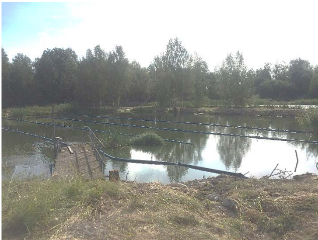
Fällningsdammar, Karbennings reningsverk

Vid reningsverket har en renovering av metangasklocka från rötgaskammare gjorts och sedan bytet av styr- och överordnarsystem har optimeringen fortsatt.