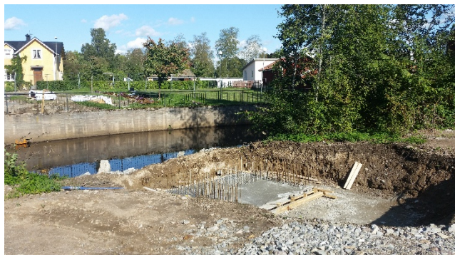
Arbete vid gång- och cykelväg vid Kv. Kronan

Investering 9939, Kv Kronan, gång- och cykelväg redovisar ett underskott på 0,1 Mkr. Avvikelsen beror på oförutsedda kostnader för markundersökningar.