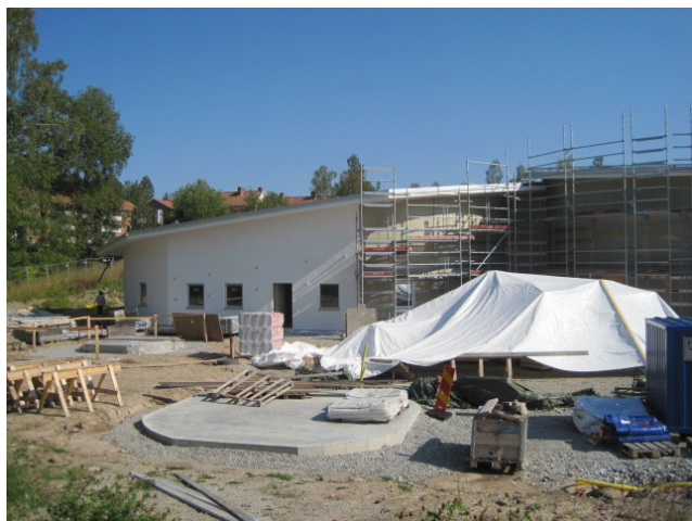
Förskolan Skogsläntan, Fagersta

Ny vattenledning till Ängelsberg beräknas ett överskott på 3,0 Mkr. En upphandling är ute och i dagsläget vet man inte när projektet kan påbörjas. Överskottet kommer belasta nästkommande år.