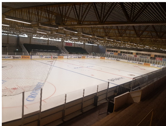
Nya plattan, Fagerliden