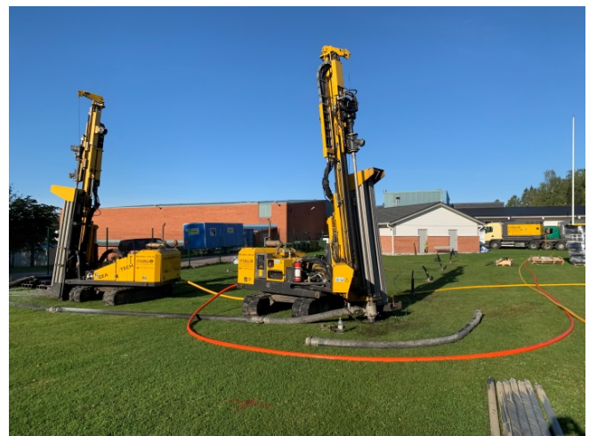
Installation av bergvärme, Fagerstahallen

I Budget 2019 beräknar man ett överskott på 33,0 Mkr. Underhållsinvesteringar, Brukskontoret, anpassning av Alfaköket till mottagningskök och större matsal, nytt äldreboende, Järntorget-Västmannavägen och Västanfors C. Järnvägstorget beräknar man inte utföra 2019. Den nya tvätthallen på Lövparken är för tillfället stoppad pga. utredning vilket gör att verksamheten beräknar ett överskott på 7,5 Mkr.