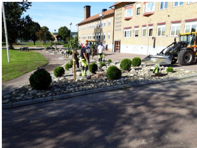
Fastighetskötsel vid Risbroskolan.

Utöver det dagliga underhållet av fastigheter sker flera större underhållsarbeten som verksamheten utför, några exempel är: