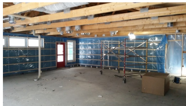
Vattenskada på Treklövern

I några av bostäderna har renovering och byte av gamla kök utförts. Stambyte och renoveringar av badrum pågår på Svanen i samband med vattenskador.