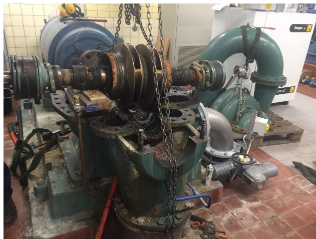
Renovering av pump, Saxen

Reningsverket i Fagersta har man upphandlat en ny centrifug för avvattning av slam, som ska installeras under 2019. Helrenovering av pumpstation i Brandbo med nytt styrsystem samt nya torruppställda pumpar har gjorts.