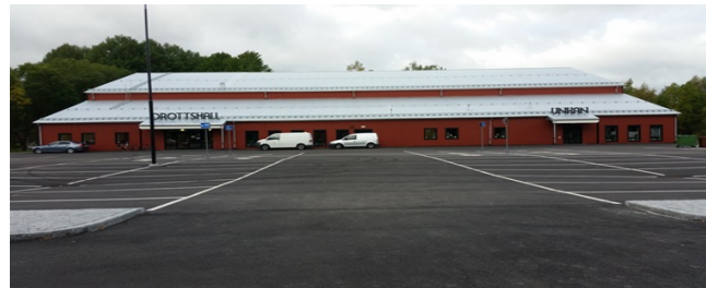
Färdigställd idrottshall Norberg.

Byggnationen av idrottshall i Norberg är klar. Byggnaden invigdes i augusti. I området runt idrottshallen pågår även arbeten med lokalgata, belyst gång- och cykelväg samt kommande bro över Norbergsån till Ågatan.