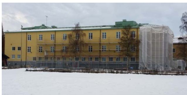
Fasad- och fönsterbyte Centralskolan

Vid Centralskolan så håller man på med att tilläggsisolera fasaden samt att byta fönster på den äldsta delen av skolan för att åtgärda kalla lokaler.