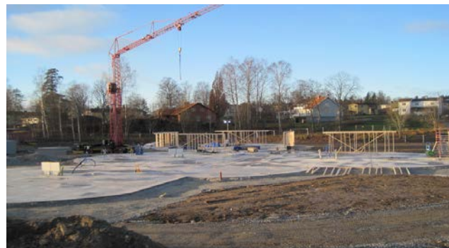
Pågående arbete Skogsgläntan.

Det pågår en nybyggnad som ska inrymma förskola, LSS-boende samt nattis. Byggnaden ska även inrymma ett mottagningskök. Utvändigt är det parkeringar för personal, platser för hämtning och lämning samt utvändigt lekyta. Den nya förskolan förses med solceller och laddstolpe för elbilar, vilket är i linje med kommunens energi- och klimatmål.