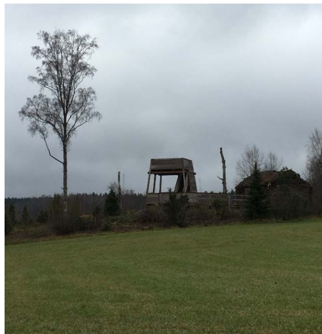
Fågeltornet i Jonhagen

I det kommunala naturreservatet Jonhagen arbetade vi under våren med att genomföra åtgärder. Vi har bland annat fällt granar. Våren 2019 kommer de sista åtgärderna att vara genomförda enligt villkoren i dispensbeslutet. Projektet ”Fågeltornsområdet” fortgår där det praktiska bygget av parkeringsplatser och gångväg har påbörjats.