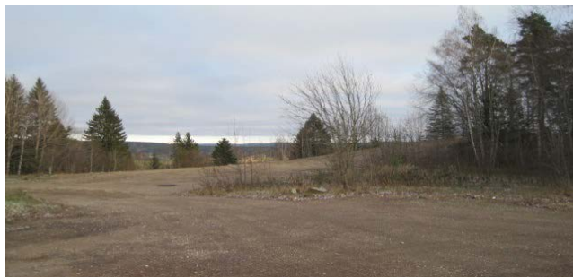
Färdigställd rivning av Högbyn.

NVK är i slutskedet av en upphandling av upp- rustning av Järntorget och Västmannavägen man räknar med att bygget ska starta i slutet av maj och vara klart i månadsskiftet november/december nästkommande år. Projektet kommer innefatta en ny parkering med bland annat el-laddningsstolpar och handikapps parkering, ny belysning, planteringar, liten vattenspegel, sol trappa och sittplatser. Västmannavägen blir enkelriktad och man får ett gångstråk ner till Brinelltorget. På Västmannavägen gör man i nuläget en VA-sanering som en förberedelse inför upp rustningen av Järntorget/Västmannavägen.