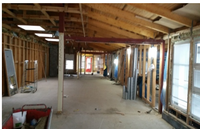
Vattenskada på Treklövern.

På förskolan Treklövern håller man på att åtgärda en omfattande vattenskada. Man kommer att riva ur hela byggnaden och sanera för att sedan återställa byggnaden. Detta beräknas vara åtgärdat till sommaren 2019.