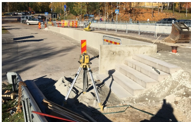
Ny gång- och cykelväg, Kyrkvägen

Högre trafiksäkerhet för oskyddade trafikanter på Kyrkvägen. På en sträcka av ca 200 m förbi Lindgården saknas gång- och cykelväg. Oskyddade trafikanter tvingas passera Lindgårdens parkering i sin väg framåt. Skolverksamheten på Lindgårdsskolan medför att grundskoleelever tvingas passera över Kyrkvägen under skoltid. Ny gång- och cykelväg byggs där det saknas och ett hastighetssäkert övergångsställe byggs för att höja trafiksäkerheten för skolelever.