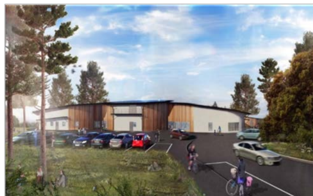
Nya förskolan Skogsgläntan

Under sommaren så har man rivit byggnader och sanerat området i Högbyn.