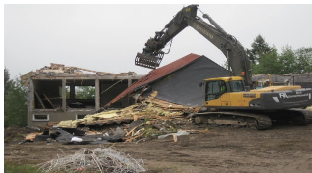
Rivningsarbeten vid Högbyn

Under sommaren så har man rivit byggnader och sanerat området i Högbyn.