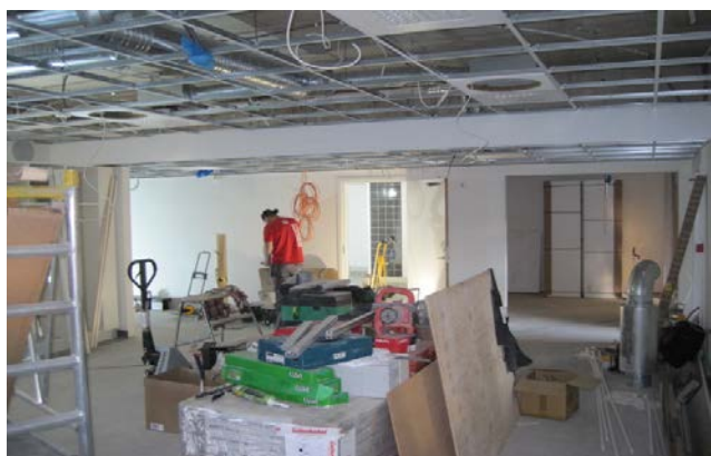
Renovering av hemtjänstlokaler

Ny uteplats för Visiten och upprustning av lokaler på Malmen. Där har man byggt om mottagningsköken på våningarna, nya personalutrymmen, förrådsutrymmen och utökade hemtjänstlokaler.