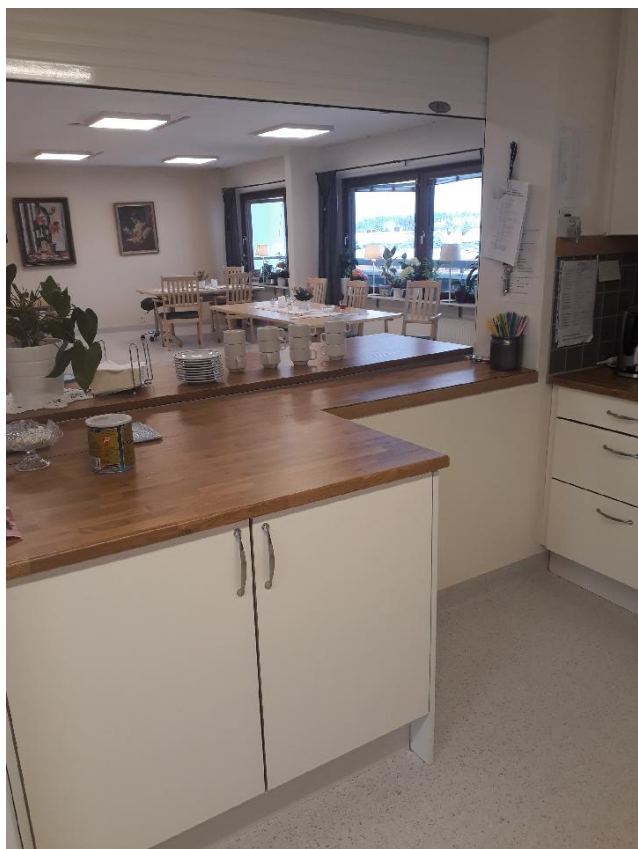
En av de fyra nya mottagningsköken, Malmen

Under sommaren så drabbades Fagersta av ett kraftigt skyfall vilket gjorde att några av fastigheterna fick omfattande vattenskador.