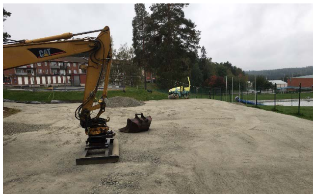
Arbete på Parkour-parken

Parkour-parken har man schaktat av och hårdgjort en yta för att sedan kunna bygga och färdigställa parkouren. Den beräknas vara klar våren 2019.