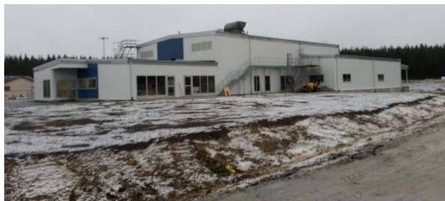
Centralköket på Fårbo, Fagersta

finnas personalutrymmen för ca 20 personal samt ett konferensrum. I projektet ingår även utvändigt anpassning av mark för ankommande och avgående leveranser samt parkering för personal och besökande. Det kommer att vara klart för inflytt till första kvartalet år 2019.