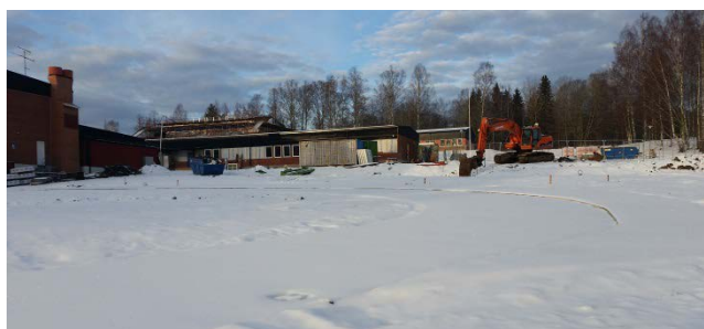
Per-Olsskolan Hus F

Per-Olsskolan Hus F pågår sista etappen av ombyggnaden av den planerade om- och utbyggnaden. Hus F kommer att få ett nytt kök samt matsal för att tillgodose verksamhetens behov av lokaler. Man kommer även att göra trafikmiljön säkrare för lämning och hämtning av barnen.