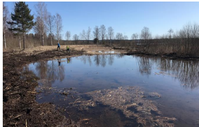
Våtmark, Norbergs kommun

Norbergs kommun har, enligt genomförandeplanen för kommunens översiktsplan, haft som mål att anlägga en våtmark på kommunal eller privat mark. Syftet skulle vara att gynna biologisk mångfald, minska växtnäringshalter i vattendrag, bidra till en attraktiv landskapsbild m.m. En våtmarkskonsult, som tillhandahölls av Länsstyrelsen, hjälpte till att identifiera lämpliga våtmarkslägen i kommunen. Två av de lämpligaste platserna bedömdes vara ett par fuktiga markområden mellan Klackberg och sjön Noren. Då markägaren var positiv till att skapa våtmarker sökte och beviljades kommunen år 2018 ett LONA-bidrag från Länsstyrelsen för att, i samarbete med markägaren, anlägga två våtmarker på 1,8 respektive 0,4 hektar. Våtmarksbygget slutfördes under sommaren 2021 genom grävning och dämning. Enligt en överenskommelse mellan kommunen och markägaren ska markägaren ombesörja och bekosta våtmarkernas framtida skötsel.