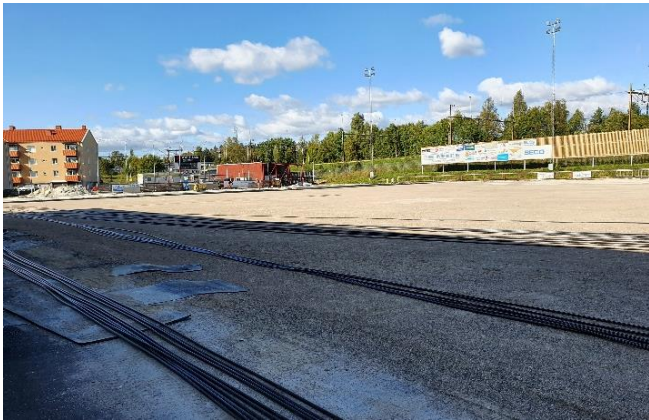
Byte kylanläggning Västanfors IP

Arbetet med att byta ut den gamla kylanläggningen på Västanfors IP pågår och beräknas vara klar i oktober 2021.