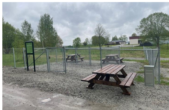
Hundrastgården i Fagersta

Efter ett e-förslag satte NVK igång arbetet med att skapa en hundrastgård bredvid reningsverket i Fagersta. I början av juni stod denna inhägnad färdig att beträdas.